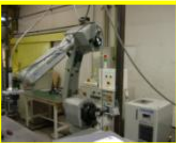
半導体レーザー(樹脂溶着)