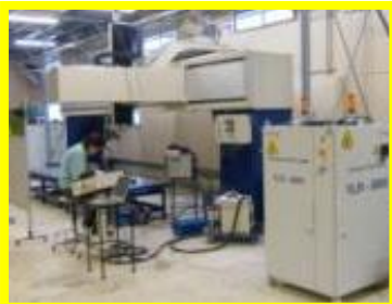
ファイバーレーザー(金属溶接)