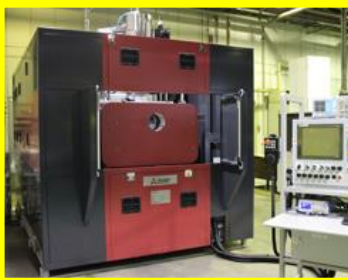
電子ビーム(金属溶接)

東日本大震災チャリティーグッズ 「i タグ」はレーザーックス工房へ http://laserx.ocnk.net/