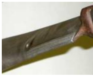
タービンブレードへの肉盛