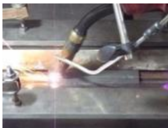
レーザー・アークハイブリッド溶接