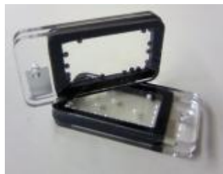
樹脂溶着(透過/吸収)