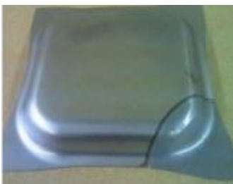
自動車鋼板テールードブラック

自動車部品の溶接ではボディ鋼板やギアのほか、電子基板やセンサー類にも適用されています。発電用蒸気タービン翼では耐熱合金の肉盛溶接が行われています。金属以外では熱可塑性樹脂の溶着があり、自動車部品や医療機器で使われています。接着剤を使わないので樹脂材料本来の強度が保たれます。漏れ試験のためのリークチェック、ビード形状や金属組織をみる断面観察、割れをみるカラーチェック、強度をみる引張試験など品質確認も行います。