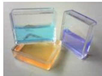
樹脂溶着(透明同士)

“伝統”と“最先端”のシナジー・エフェクトでお客様に確かな「ものづくり」を提供します