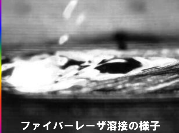
ファイバーレーザー溶接の様子

0566-83-2229 (愛知) メールは ↓ 045-549-0480 (横浜) sale@laserx.co.jp