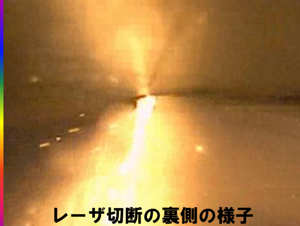
レーザー切断の裏側の様子

0566-83-2229(愛知) メールは ↓ 045-549-0480(横浜) sale@laserx.co.jp